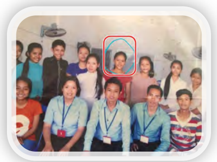
미래로 학교 친구 선생님들과