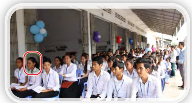
미래로 학교 졸업식